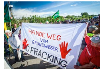
Reizthema Demonstration gegen Fracking in dem Ort Saal (Mecklenburg-Vorpommern)

Dabei geht es um Änderungen des Wasserhaushalts- und Bundesnaturschutzgesetzes und der Grundwasserverordnung. Bei den Beratungen sind die Fach-